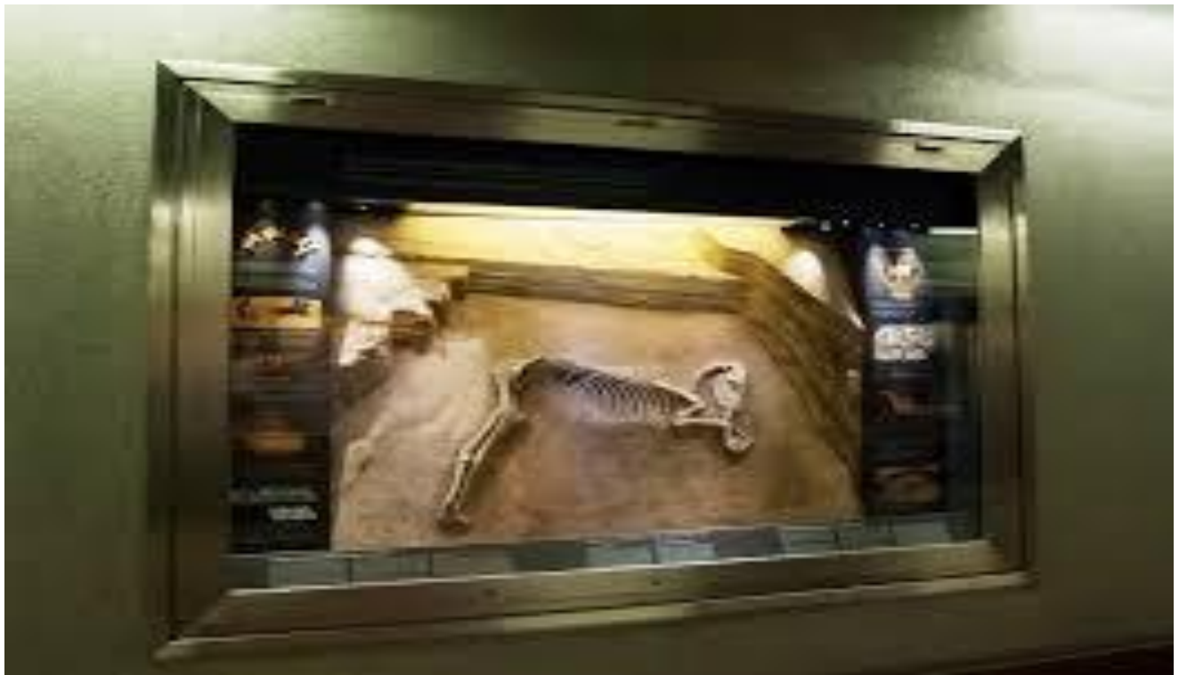
”The horse of Elaionas” – Stația de metrou din Aigaleo

” Drumul sacru ” făcea legătura dintre orașele Atena și Eleusis. Acesta era drumul parcurs cu prilejul sărbătorii ”Misterele din Eleusis”. Misterele din Eleusis au fost sărbători bianuale ținute în Grecia antică în templul din Eleusis dedicate zeiței Demetra și fiicei ei Persefona din recunoștință pentru darul agriculturii. Conform legendei, eleusinii erau protejați de Demetra fiindcă se arătaseră primitivi față de ea când luase înfățișarea unei bătrâne sărmâne, atunci când o căuta pe fiica ei Persefona.