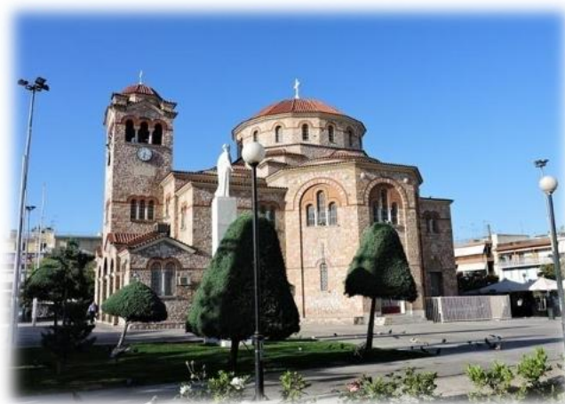
Holy Temple of Exaltation of the Holy Cross of Aigaleo ("The Crucified")